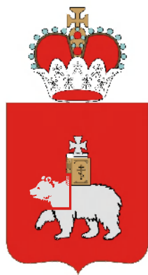
Правительство Пермского края