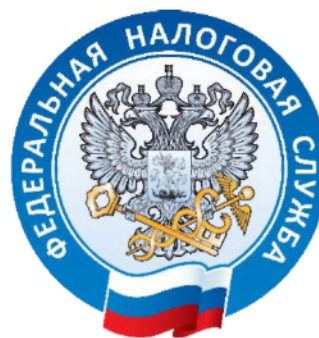
УФНС России по Пермскому краю